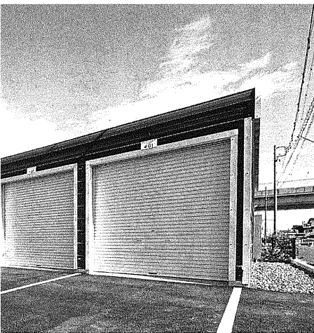
して利用が進むアメリカンストレージ

ASは、空き地や遊休地を安定した収益資産に転換する低リスク型ストレージビジネスで、同社は愛知県内で